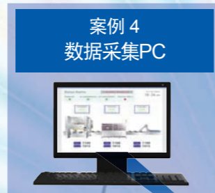
案例 4 数据采集 PC